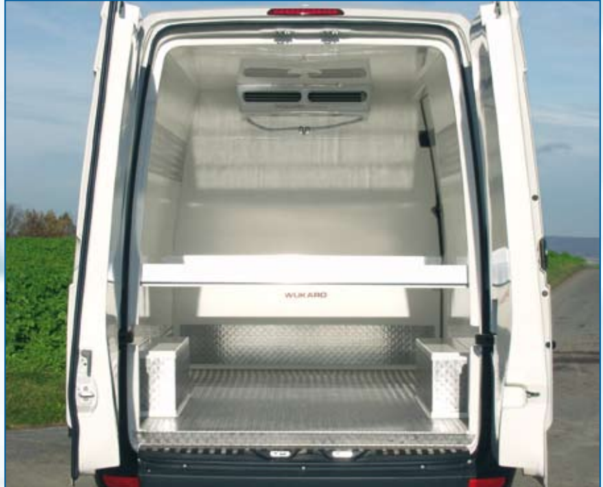
Ein- oder zwei Reihen eingelassene Aluminium-Scheuerleisten gegen Aufpreis lieferbar.

Voll integrierte Trittstufe mit Aluminium-Trittschutz.* alle mit * gekennzeichneten Ausstattungen sind serienmäßig.